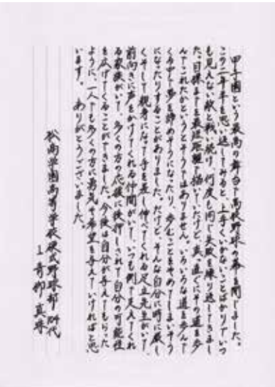
『松商学園のユニフォームを着て野球が 出来たことは一生の誇りです。』 by 青柳真珠