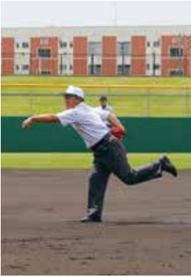
H30.5.26に行われた作新学院との招待試合で始球式を行う福岡OB会長

松商野球部の甲子園出場ならびにOB会の発展、皆様のご多幸を祈念してあいさつとさせていただきます。